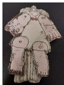
Grete Bull Sarning relief

Auktion: Vi gentager auktion over nogle spændende værker for af styrke foreningens økonomi