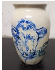
Vase Anne Gyrite Schütt