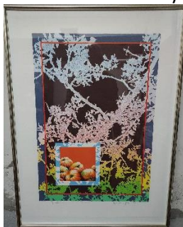
Poul Janus Ipsen Litografi