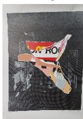
Preben Franck Stelvig Litografi

Udlodning: lodtrækning mellem de tilstedeværende medlemmer om i løbet af årene indkøbte værker: