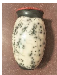
Raku vase af Bjarne Hansen, Lundby