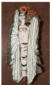
Grete Bull Sarning relief

Auktion: Vi vil i år forsøge at lave auktion over nogle spændende værker for at styrke foreningens økonomi