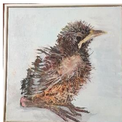
Eva Kobberrød (maleri af fugl)

Udlodning: lodtrækning mellem de tilstedeværende medlemmer om i løbet af årene indkøbte værker: